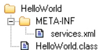
Abbildung 3.1.: HelloWorld-Webservice: Dateistruktur

Mit Hilfe von Apache Axis2 können Webservices sehr einfach auf Basis von normalen Java-Klassen angeboten werden. Es ist lediglich eine zusätzliche XML-Datei namens META-INF/services.xml nötig, in der die zu veröffentlichenden Klassen und Methoden beschrieben werden. Abbildung 3.1 zeigt die Struktur eines einfachen HelloWorld-Webservice.